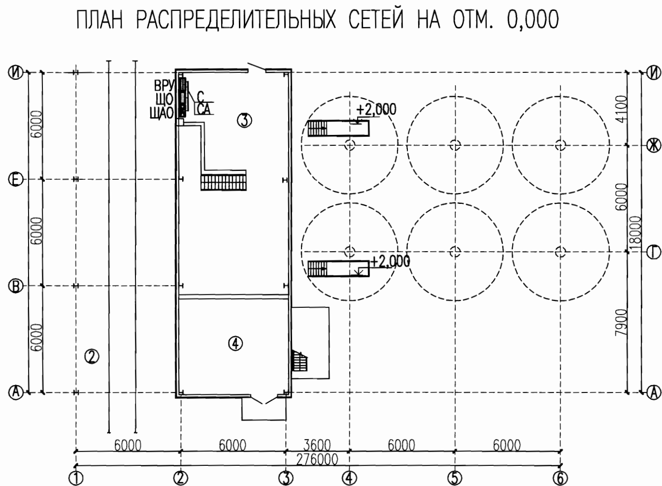
ПЛАН РАСПРЕДЕЛИТЕЛЬНЫХ СЕТЕЙ НА ОТМ. 0,000